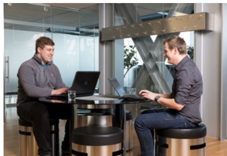
- Informationstechnologie – Technik - Bürokaufmann/-frau