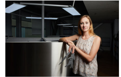
- Technische*r Zeichner*in