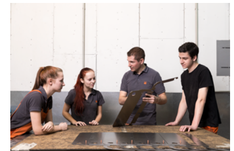
- Metalltechnik – Hauptmodul: Metallbau- und Blechtechnik - Prozesstechniker*in - Oberflächentechnik – Schwerpunkt: Pulverbeschichtung - Betriebslogistikkaufmann/-frau